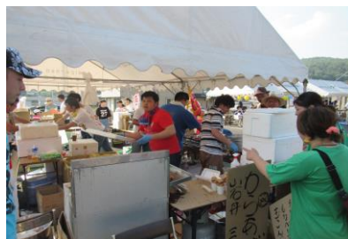
忙しい！忙しい！忙しい！