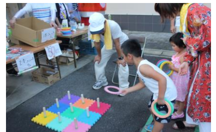
しかりねらうんじゃー！