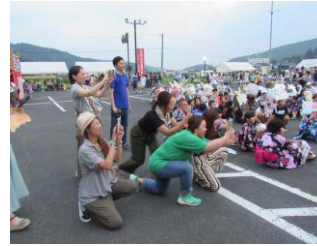
お母さんたちも大喜び！