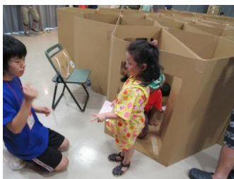
「ジャンケンポン 僕の負け」