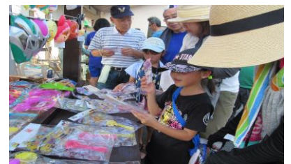
どのお面がいいかなー