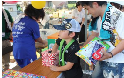
どれにしようかな～