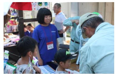
「かき氷おいしいよ」