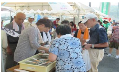
あっという間に売り切れだー