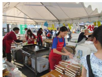
「エプロン姿がよく似合います」