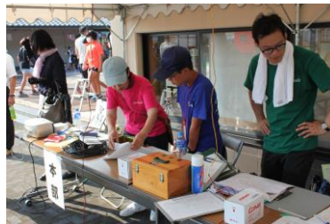
「このアナウンスをお願い」