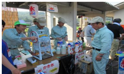
暑い日はかき氷が1番