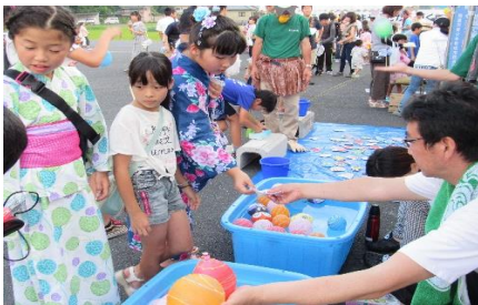
夏祭りは浴衣だねー