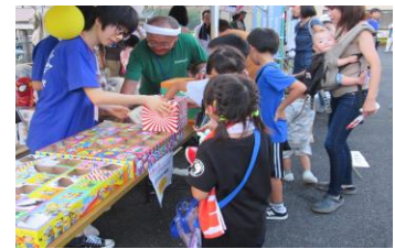
「くじ引いて！当たりー！」