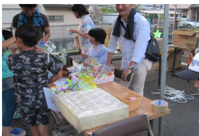
1億円も売ってます。