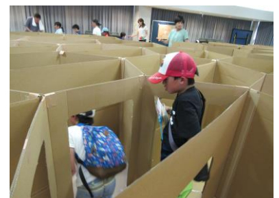
六角迷路 無事出られました