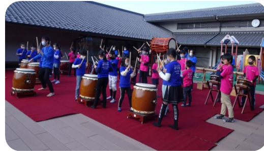
演奏者全員により「楽」の演奏