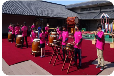
公民館講座 太鼓をたたこう