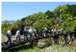
昔懐かしい木橋【蟹淵橋上】