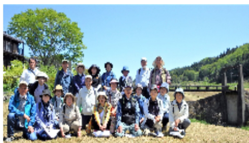
半分青いロケ地【平山橋】の前で集合写真