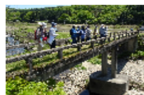
【刈宿橋】 下流には「カッパ淵」