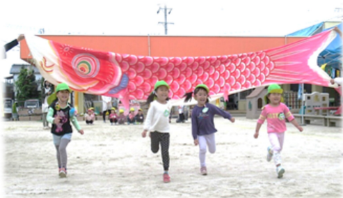
【思いっきり走るよ！わたしが1番！】

「こいのぼりかけっこ」では、大きなこいのぼりに向かってよーいどん！小さな子も大きな子も思いっきり走る姿が頼もしかったです。思いっきり走った後には5歳児さんからステキな模様の手作りこいのぼりのプレゼントがありました。小さな子の嬉しそうな表情や「ありがとう」のこぼれに、お兄さんお姉さんという気持ちが実感できたと思います。