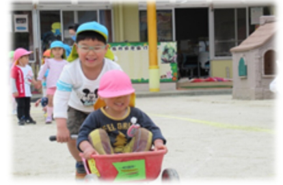
【おとさないように、ゴーゴー】

「手押し車競争」をしました。5歳児さんが小さな子を手押し車に乗せてコーンを回ってくる競争です。小さな子が落ちたりしないようにそっと運転する様子が見られました。張り切る姿や真剣な表情が見られました。前日に5歳児さんだけで友だちを乗せる練習をしました。家でも人形を乗せて練習した子もいたそうです。本番では「小さな子に乗せるんだ！頑張るぞ！」という気持ちで臨むことができ、練習の成果もバッチリ！達成感を味わうことができました。