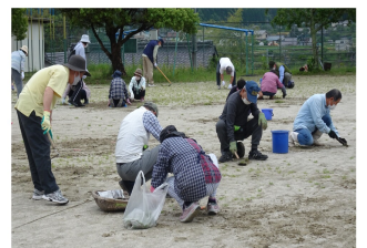
【5月20日草取りの様子】

公民館も「できることから始めよう」を合言葉にスタートしています。町民の皆さんのご来館をお待ちしています。(A)