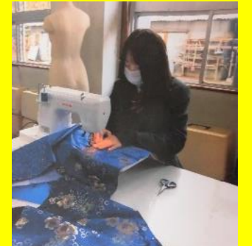
【ミシンがけも慎重に】