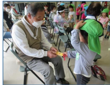
おじいちゃんへ 「しめ縄を作ったよ。使ってね!」