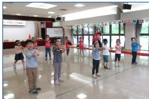
忍者になって「手裏剣シュシュ」