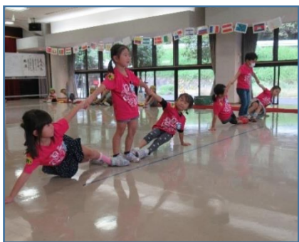
バランス体操、 気持ちを合わせて頑張るよ!

子供たちが楽しく参加できるように考えて計画して下さった釜戸楽園の方に感謝です。これからも地域の方と一緒に過ごす機会を楽しみにしています。ありがとうございました。