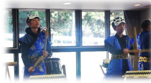
小学校を卒業する青龍子ども組の2人 カッコイイ!!