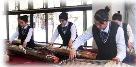
多治見西高等学校 琴演奏 心に沁みました