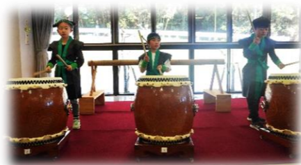
短時間での練習にもかかわらず 当日はパッチリでした