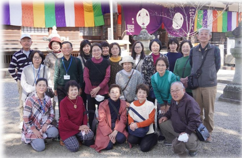
【ほのぼのとした旅でした 大樹寺にて】

3月6日(月)、NHKの大河ドラマで話題の岡崎に行ってきました。参加者は20名。大河ドラマ館・岡崎城・大樹寺を巡り、昼食は八丁味噌煮込膳をいただきました。参加した皆さんから「ゆったりした良い旅行でした」「大樹寺では、歴代将軍の等身大位牌が見ることができてよかった」と感想をいただきました。