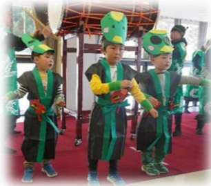
「よすけとかっぱ」 かっぱになって踊った園児 可愛かった♡