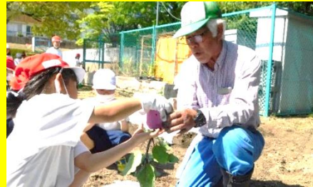
【子供たちのために】

本当に幸せなことです。子供たちは地域でも愛され、大切にされていることを実感することでしょう。そんな安心感の中で子供たちは大きく育ちます。子供の笑顔のため今後とも地域の皆様よろしくお祈りします。