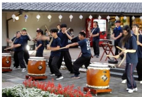
「釜戸音頭」に太鼓伴奏がつけました 【中京高校和太鼓部】