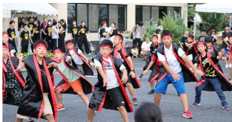
釜戸小学校児童による力強い演技