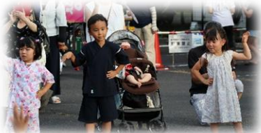
幼稚園園児のかわいい踊り♪