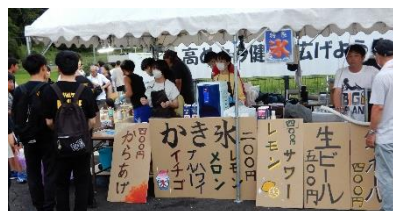
食べ物屋さんも充実！